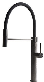
Miscelatore Skin Gun Metal 8424 856