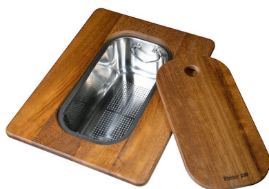
Tagliere Twin in legno Iroko con vaschetta scolapasta in acciaio inox

* solo in abbinamento con l'accessorio 8644 101