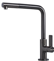
VELA PLUS GUN METAL satinato 8498 126